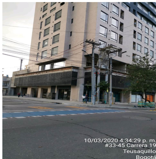
Fotografía No. 1.