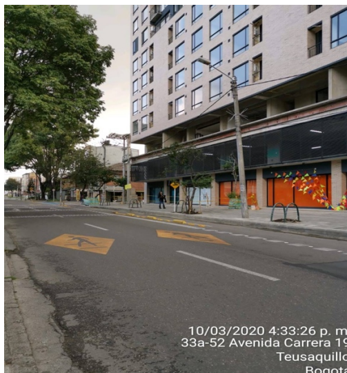
Fotografía No. 2.

De acuerdo a las fotografías N.1 y No.2 se puede afirmar que el proyecto “Duo 33” ha finalizado sus actividades constructivas, por tanto dando cumplimiento a la normativa vigente se procede a evaluar el porcentaje de aprovechamiento alcanzado en toda su ejecución hasta su culminación.